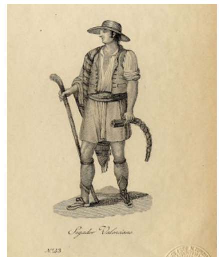
Segador valencià segle XIX