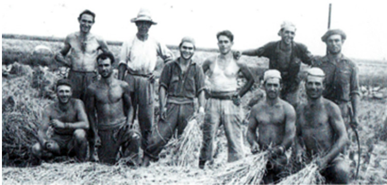
Quadrilla de segadors d’Antella