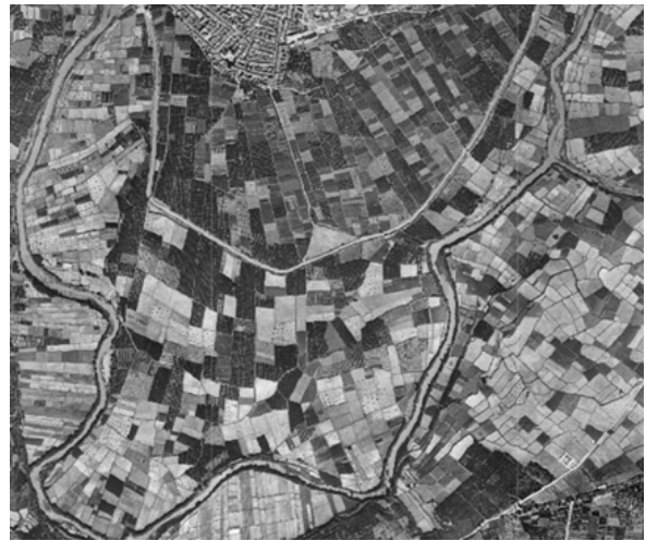
Camps d'arr3s al terme d'Antella

noventa cuyas tierras de tiempo muy antiguo se hace arroz en ellas, sin que se sepa cosa en contrario”