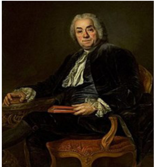
Comte de Caylus (1692-1765)