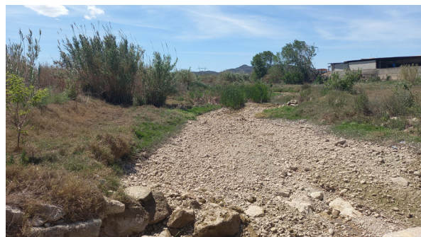
Riu Albaida sec.