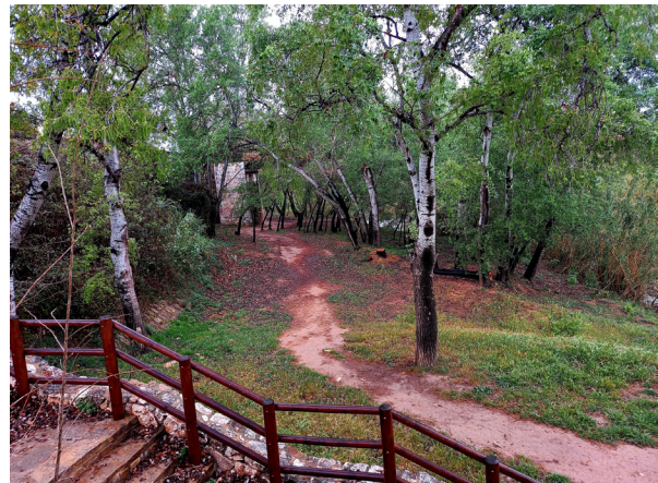
Sender fluvial a Alzira.

En definitiva una nit magnífica a Fortaleny, a la Ribera Baixa, prop del riu Xúquer, que va fer retrobar-se a moltes persones unides en la lluita per un Xúquer viu.