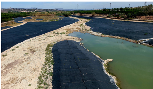
Canya a la canya al riu Albaida.

Recentment un centenar de persones rellevants també van donar suport a un manifest de contingut similar.