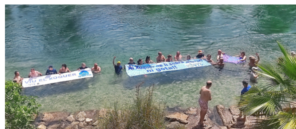
Mulla't pel riu, a Sumacàrcer.

-comenta un dels més de cent participants en la davallada popular en piragua. Esperem que aviat el Xúquer tinga aquest bon aspecte fins a Cullera.