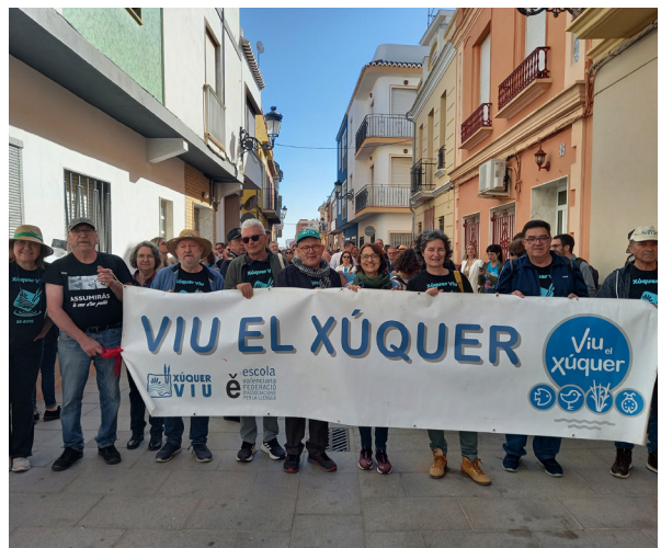
Trobada a Benimodo.