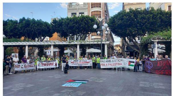
Concentració per la Pau a Alzira.

Per a Xúquer Viu la solució seria fer aportacions directes d'aigua del Xúquer des de Tous, sense estar condicionades a la modernització de regadius, com ha demanat en repetides ocasions. Aquestes aportacions, que ja s'han fet en el passat, ara són més urgents que mai. En una situació com l'actual amb les reserves hídriques properes al 50%, és perfectament possible fer les transferències d'aigua per assegurar el cabal ecològic de l'Albufera.