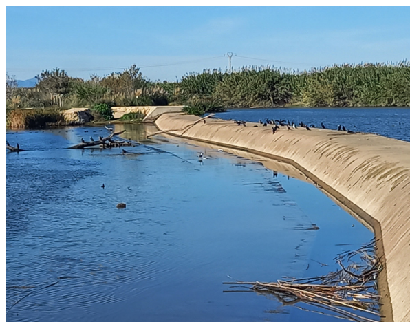
Assut de la Marquesa seca

La UNESCO declara la «Maerà» d'Antella Patrimoni Cultural Immaterial de la Humanitat. Els ganxers de «Maeros del Xúquer» d'Antella mostren la seua satisfacció.