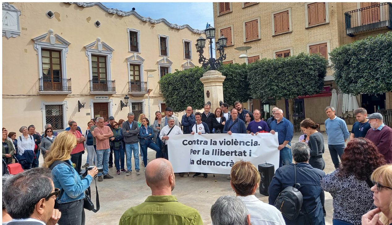
Concentració a Alginet contra l'atemptat

Deixa un record inesborrable en totes les persones que la coneguérem. Un dia trist per als seus amics i amigues. Des de Xúquer Viu