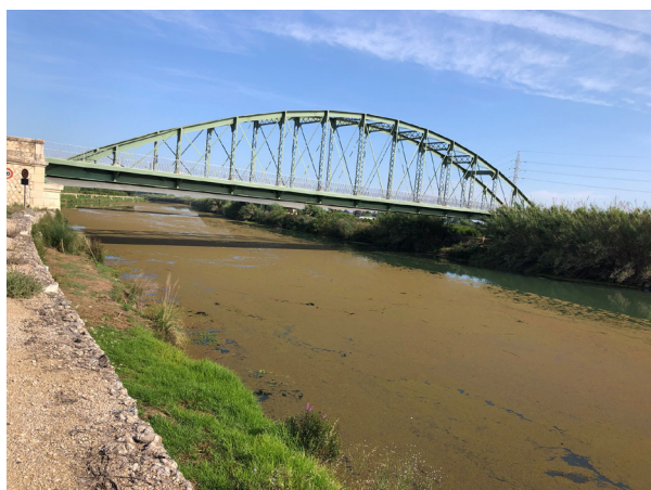
Falguera invasora cobreix el riu

La « ludwigia grandiflora », la planta invasora torna a aparèixer al riu Albaida per Manuel, i pel Xúquer es deixa veure entre Riola i Fortaleny, les característiques flors grogues de la planta invasora, que de vegades ha arribat a colonitzar trams complets del riu Albaida.