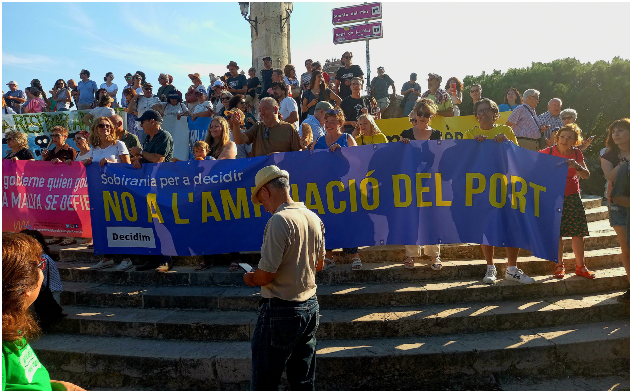
Manifestació “No ampliació Port” de València

d’Antella i La Ribera en bici. Després de la lectura del Manifest una gran part dels assistents han pres el bany per reivindicar rius nets i vius