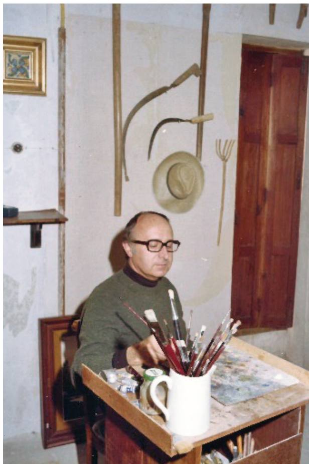
Isaías Minetto al seu estudi, 1976

Entre els guardons i premis més importants aconseguits per Minetto dins la seua trajectòria artística destaquen la "Paleta de plata" en el IV Gran Prix Internacional de la Riviera a Grassa (Nissa), el 2n premi en el XI Saló d'Art Modern per a artistes estrangers a Verona i la menció d'honor a la sala Maison de Jeunes et la culture a Paris.