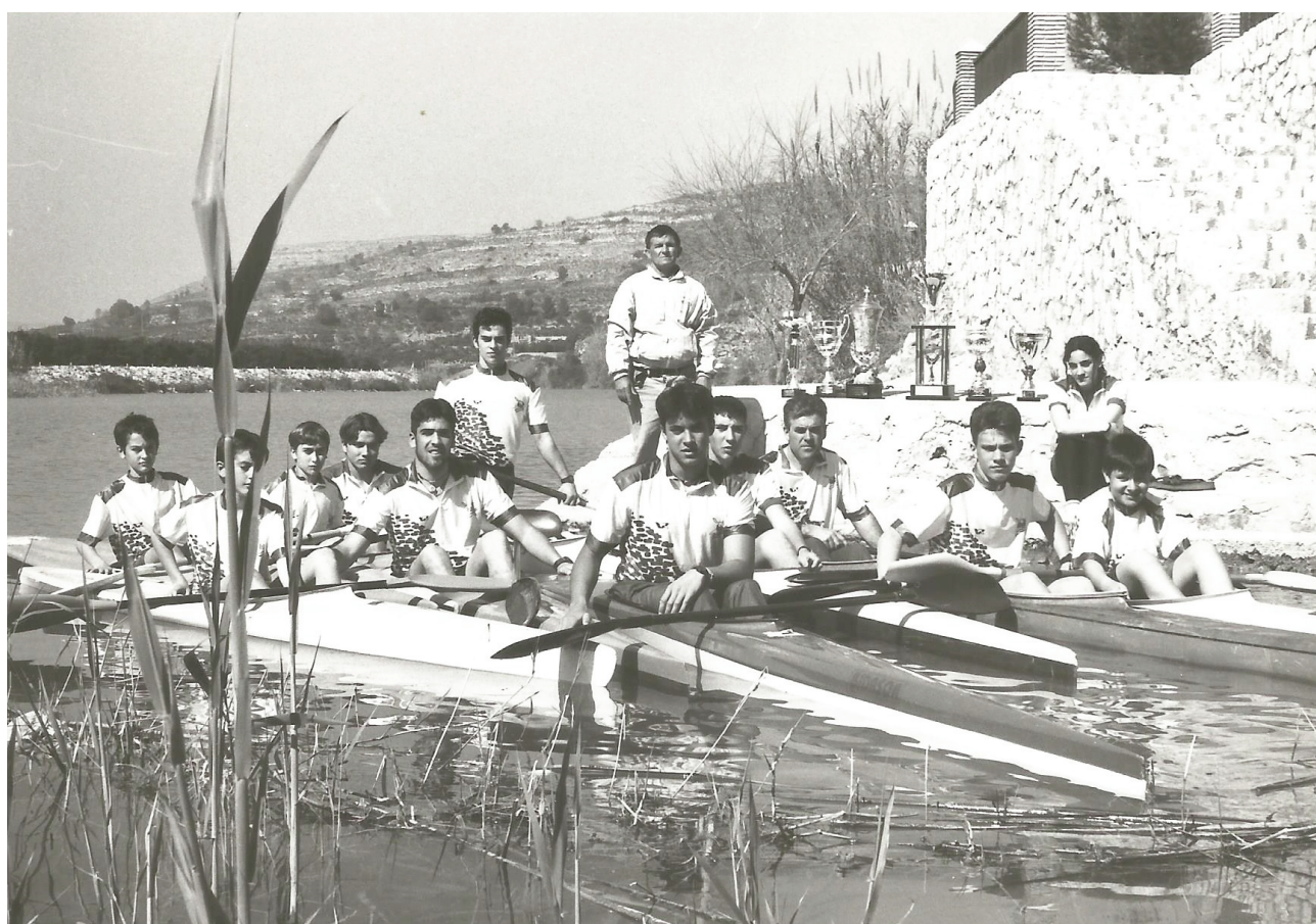
PPA febrer de 1997