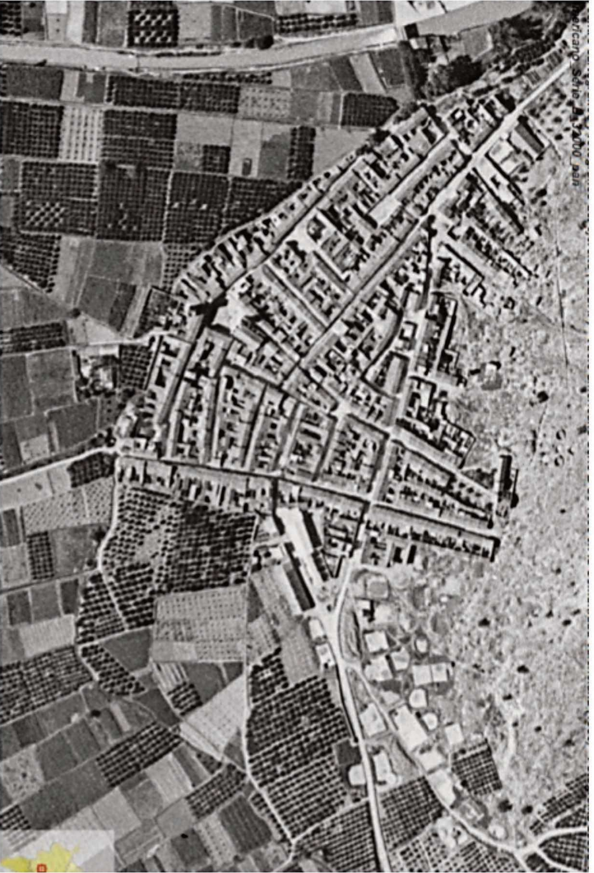
Plànol d'Antella en 1956. El poble s' ha estès fins a la muntanya respectant el perímetre d'horta marcat pel recorregut de la séquia del poble. A la dreta de la fotografia es pot apreciar la primitiva horta islàmica d'Antella i el camí vell de Gavarda.