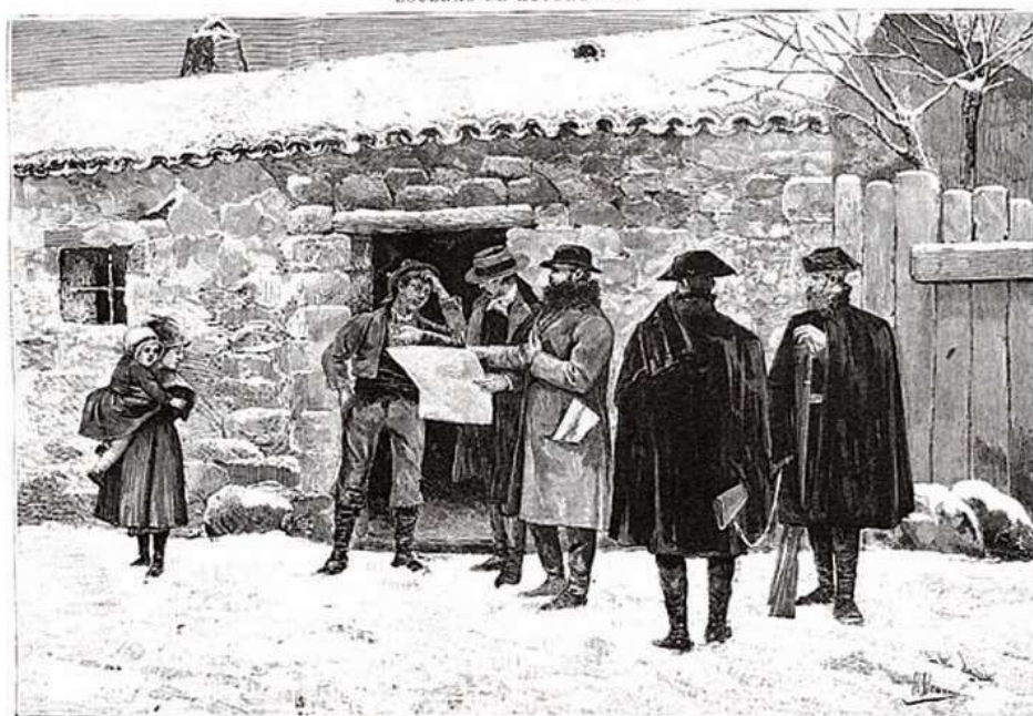
«EL CENSO DE POBLACION.» — DIBUJO ORIGINAL DE MANUEL ALCAZAR.