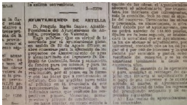
Gazeta de Madrid, 14 de desembre de 1926

El projecte va resultar molt ambiciós i per tant, molt car. Segons les dades de l'enginyer, el cost de les tres obres era: